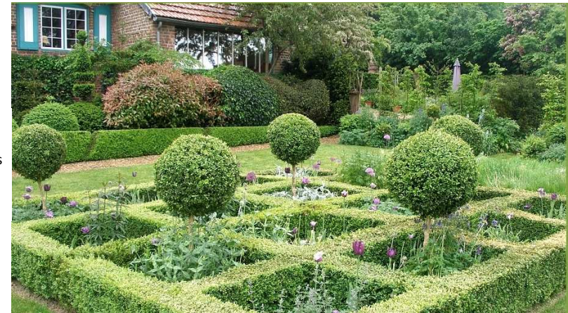
Jardin des Récollets Cassel.

Entrée et conférence gratuites. Nous vous attendons nombreux. Merci de faire circuler cette information auprès de vos contacts et amis.